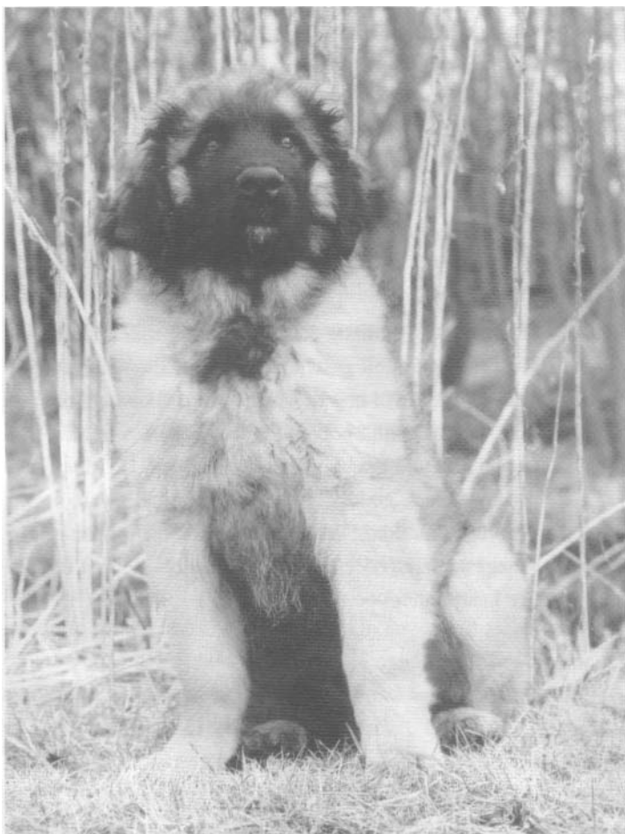
Memicedaiska Quintessens Mc Fly

Vroeger werd de Leonberger nogal eens op boerderijen en hofsteden gehouden als waakhond. Die taak heeft hij echter lang geleden al aan de wilgen gehangen en tegenwoordig zien we hem eigenlijk alleen nog maar als gezinshond. Toch is hij zijn vroegere werkzaamheden niet helemaal vergeten en bewaakt hij nog steeds trouw het huis van zijn baas. Dat doet hij overigens op een bedachtzame, rustige manier. Hij slaat aan als het nodig is en zal zeker op zijn strepen blijven staan, maar is geen overdreven herrieschopper. Hoeft natuurlijk ook niet, als je zo'n ontzagwekkend voorkomen hebt. De goede Leonberger is een rustige, stabiele en gemoedelijke hond met een vrij zacht maar wel sterk karakter. Natuurlijk wordt hij niet vanzelf zo en moet