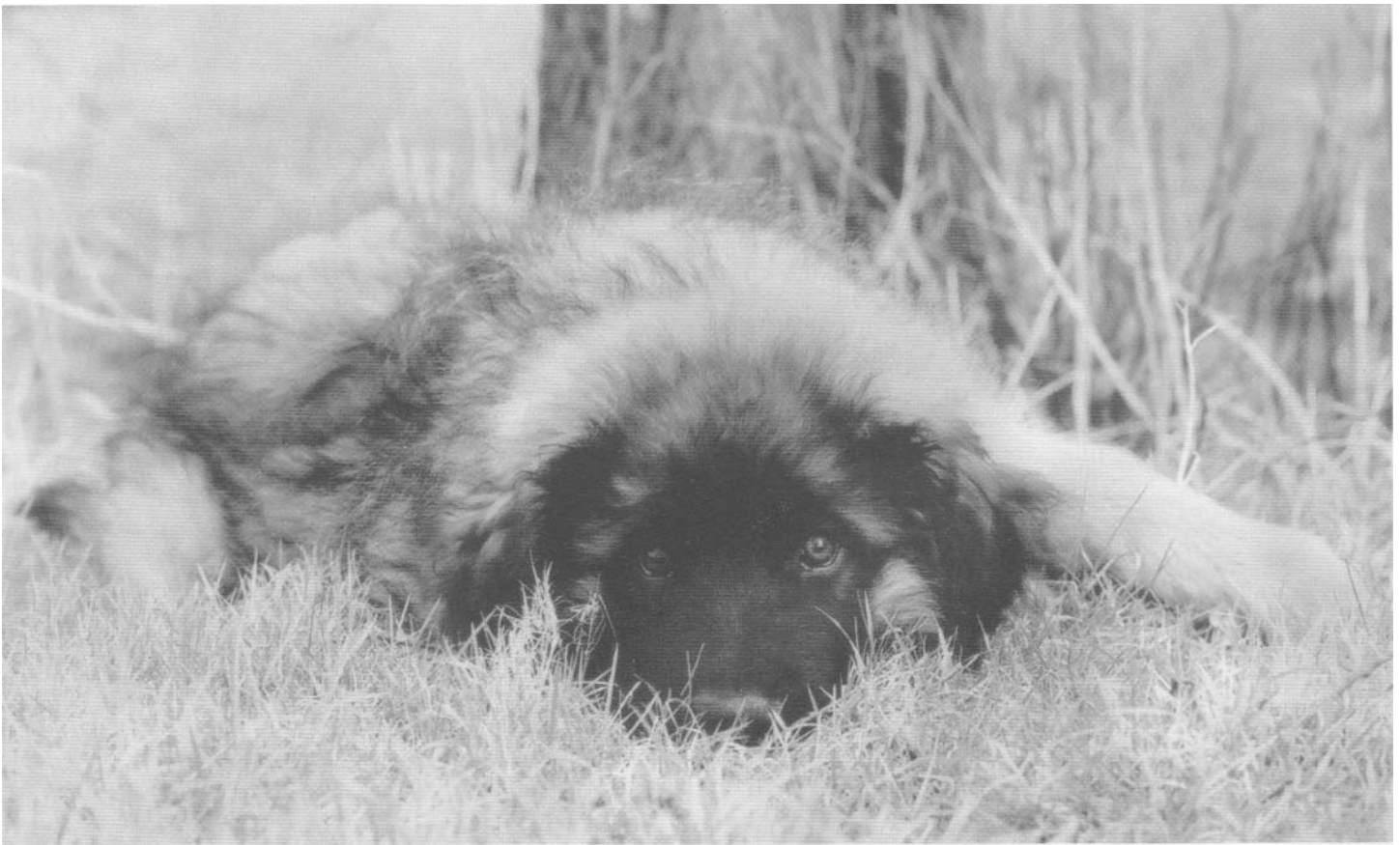
Memicedaiska Quintessens Mc Fly

Helaas gooide de volgende wereldoorlog roet in het eten en liep het zo pril opgebouwde bestand aan Leonbergers in zo'n rap tempo terug dat er na de oorlog nog maar weinig honden over waren. Wederom lukte het de Leonberger weer op het spoor te krijgen en nadat in 1949 het ras door de F.C.I. werd erkend volgde eindelijk zijn lang verdiende zegetocht. Er werd met zeer veel enthousiasme aan het herstel van het ras gewerkt en sinds die tijd is de kwaliteit van de Leonberger met sprongen omhoog gegaan. Ook in aantallen is de Leonberger sinds die tijd fors gestegen. De geschiedenis van de Leonberger is dus geen open boek en is ook zeer beslist niet over rozen gegaan. Maar eind goed, al goed. De Leonberger is er en, afgaande op zijn tegenwoordige populariteit, zal hij ook nog wel een tijdje blijven.