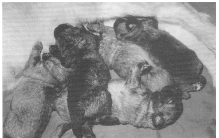
Pups van kennel Yarnousch

Als pup zijn Leonbergers aandoenlijke Teddybeertjes die nog in de verste verte niets weg hebben van de imposante honden die ze eens zullen worden. Maar kleine hondjes worden -in dit geval - snel groot. Op volwassen leeftijd is de Leonberger een grote, krachtig gebouwde maar toch elegante hond met een indrukwekkend maar tegelijkertijd goedmoedig uiterlijk. En hoewel mensen weleens afgeschrikt kunnen worden door zijn grootte,