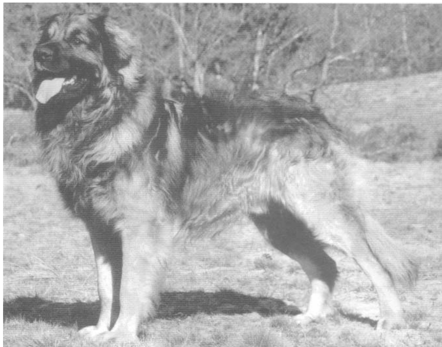
Yarnousch Amazing Kylian